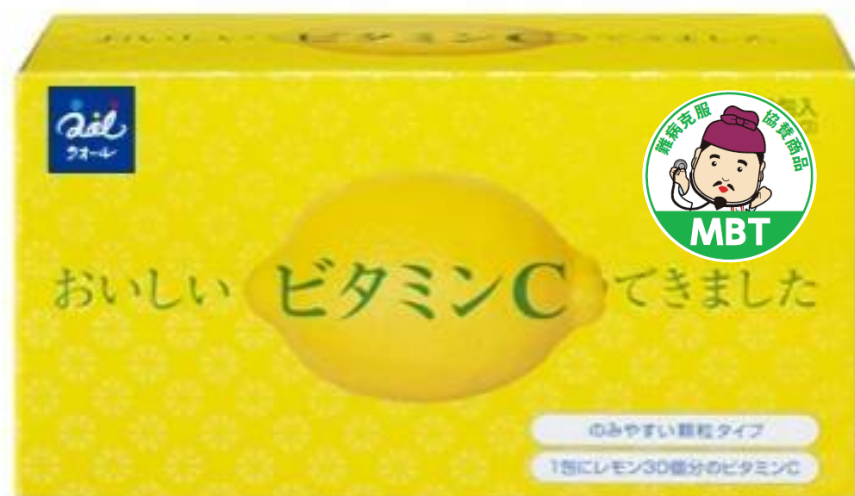
クオールおいしい ビタミンCできました 90包 3000円