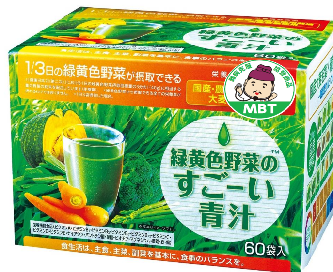
東洋新薬緑黄色野菜の すごい青汁 60袋 3000円