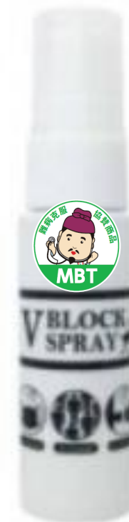
V BLOCK SPRAY