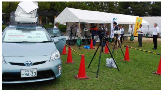
↑防災訓練参加風景 ←大災害時通信遮断下を想定した負傷者の医療的救済デモ