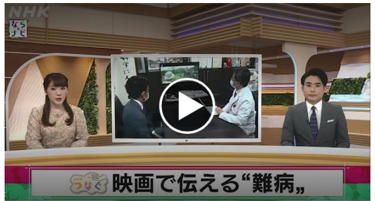
↑NHK放映映像のスタート画面