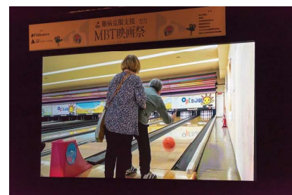
奈良医大有志学生による作品「豊かに生きるマニュアル」

奈良医大は、MBT (Medicine-Based Town:医学を基礎とするまちづくり) 活動において、現在、希少な疾患ゆえに社会から放置されがちな難病やそれに苦しむ患者さまの苦境を、多くの人々にご理解いただくための啓発活動として、「MBT難病克服キャンペーン」を展開しています。