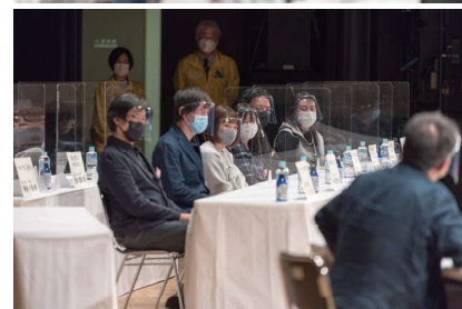
第一回MBT映画祭 入賞監督と審査委員とのトークセッション