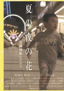
【題名】 夏の夜の花 【監督】 高橋伸彰氏

主人公 真田信二は吃音に悩む小学5年生。内気な性格で友達もいなかったが、転校生 椿啓介と出会い仲良くなる。実は啓介にもある秘密があり…。