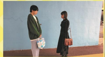
【題名】 Secret of magician 【監督】 小野光洋氏

ある日、鏡をみていたら突然現れたそれ。心や頭にわいてくる色々を気付けばそいつと共有してた。