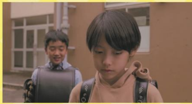
【題名】 ぼくときみの小さな勇氣 【監督】 相馬雄太氏

妹が事故に遭い、翔は急ぎ故郷へと帰る。足が動かなくなった妹はそれでも夢を諦めず懸命に生きようとしていた。