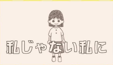
【題名】 「私じゃない私に」きょうだい児のものがたり 【監督】 吉田ゆかり氏

大阪で生活する中華系の母子。4歳になるヤンヤンは、父と数ヶ月会っていない。ある日、父が描いた花火の絵を見つけ、母と花火を見に行く約束をするも、母は忘れてしまう。