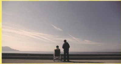
【題名】 レミングたち 【監督】 角洋介氏

妹が事故に遭い、翔は急ぎ故郷へと帰る。足が動かなくなった妹はそれでも夢を諦めず懸命に生きようとしていた。