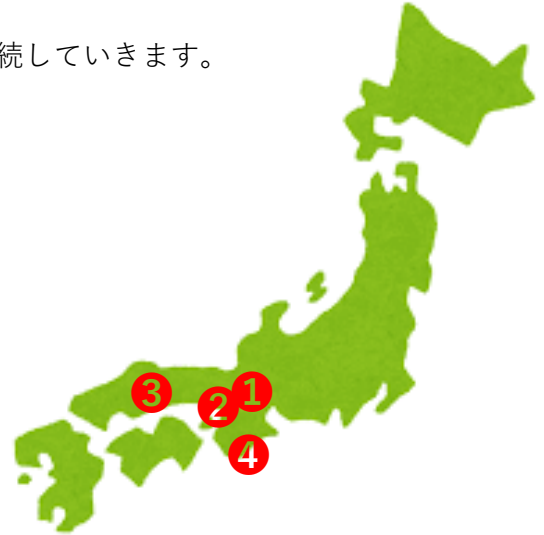
MBT映画作品の地域上映会の状況