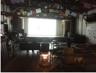
実施会場の様子 (左上) ①けいはんな映画劇場 (右上) ②MBTうめきた映画劇場 (左下) ④和歌山田並劇場