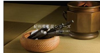
紀州備長炭シリーズ