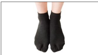
外反母趾対策靴下