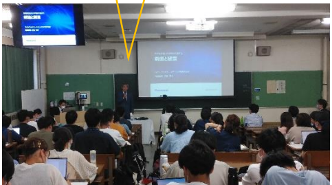
↓講義室での 公開講義の様子