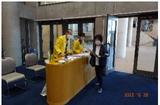
左上：けいはんなプラザ外観 左中下：メインホール受付 右上：上映前の事務局挨拶