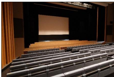
MBTいのちの映画祭会場 (上) 日経ホール入口 (下) 日経ホール内