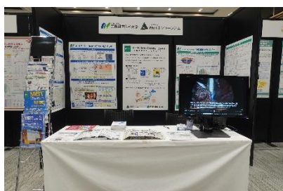
ポスター・チラシ展示の様子