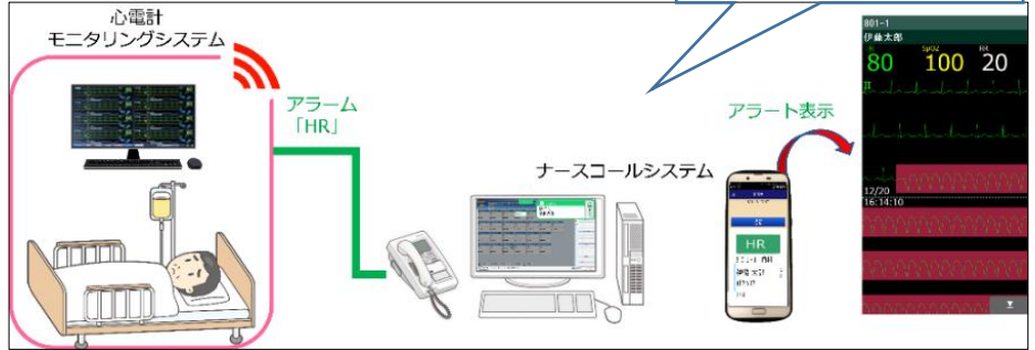
図2. -波形連携システム-tsunagu-つなぐ・MBT